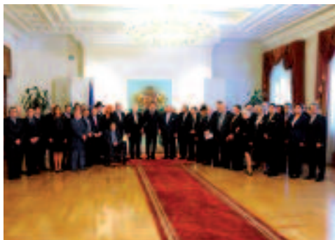
Από τη συνάντηση των εκπροσώπων του Εβραϊσμού με τον Πρόεδρο της Βουλγαρίας