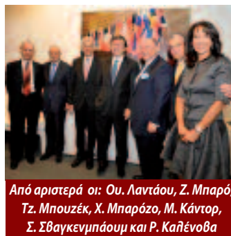
Από αριστερά οι: Ου. Λαντάου, Ζ. Μπαρό, Τζ. Μπουζέκ, Χ. Μπαρόζο, Μ. Κάντορ, Σ. Σβαγκενμπάουμ και Ρ. Καλένοβα

Στη συνέχεια ο πρόεδρος του EJC παρέθεσε δείπνο στους προσκεκλημένους κατά το οποίο επίσημοι καλεσμένοι ήταν ο Ισραηλινός υπουργός Δρ Ούζι Λαντάου και ο πρόεδρος της Γερουσίας του Βελγίου κ. Αρμάντ ντε Ντεκέρ, ο οποίος επέδωσε