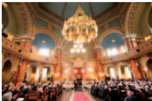
Από τα εγκαίνια της ανακαινισμένης Συναγωγής της Σόφιας

Πολύ ενδιαφέρουσα ήταν, επίσης, η ιδιαίτερη συνάντηση που είχαν οι εκπρόσωποι του διεθνούς εβραϊσμού, με επικεφαλής τον